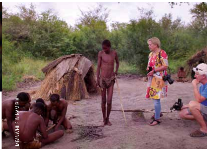
MEANWHILE IN NAMIBIA

Das DOK.fest München ist eine wichtige Bühne für den Dokumentarfilm. Wir zeigen eine Auswahl der besten Filme von diesem Jahr!