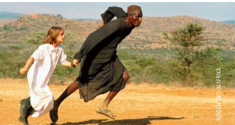
NIRGENDWO IN AFRIKA