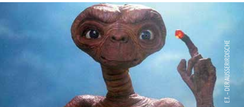
E.T. - DERAUSSERIRDISCHE