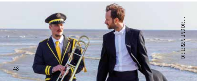
DIE LEISEN UND DIE...