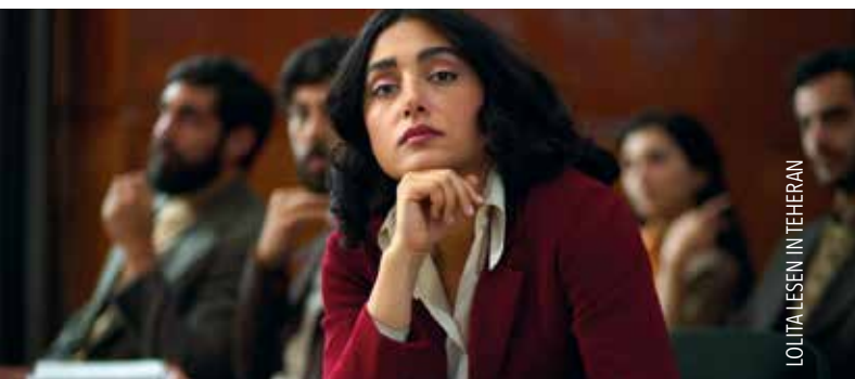
LOLITA LESEN IN TEHERAN