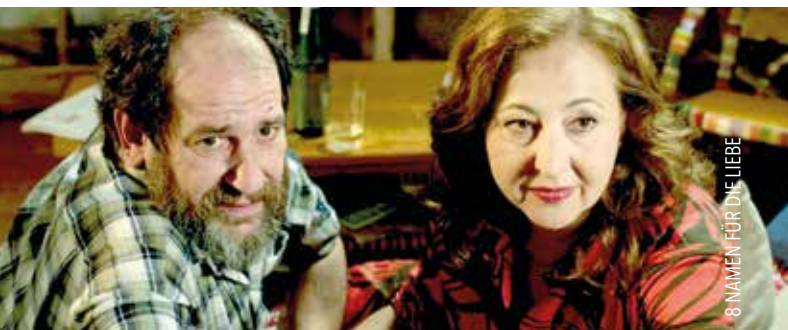
8 NAMEN FÜR DIE LIEBE