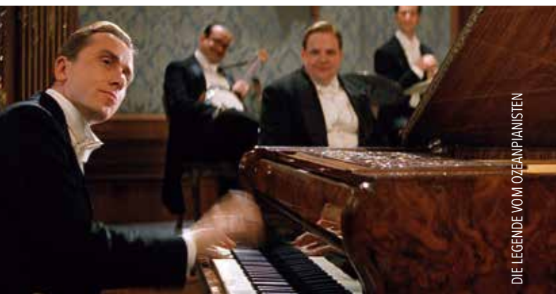
DIE LEGENDE VOM OZEANPIANISTEN

Bilder und Musik verbinden sich zu einer untrennbaren Einheit.