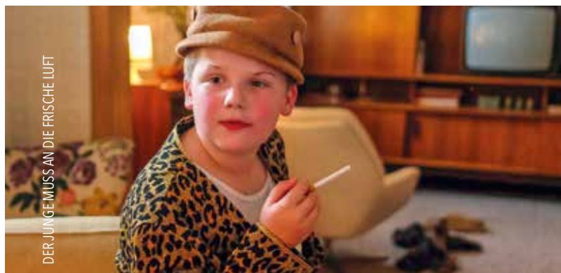
DER JUNGE MUSS AN DIE FRISCHE LUFT

Sa 1.8. 16:00 Arena · Sa 8.8. 16:00 Arena