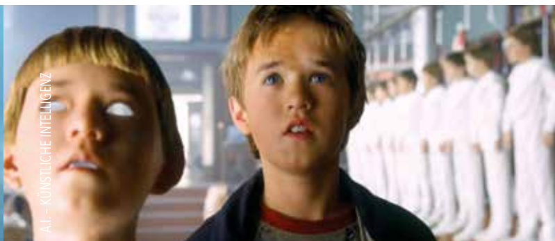
A.I. - KÜNSTLICHE INTELLIGENZ