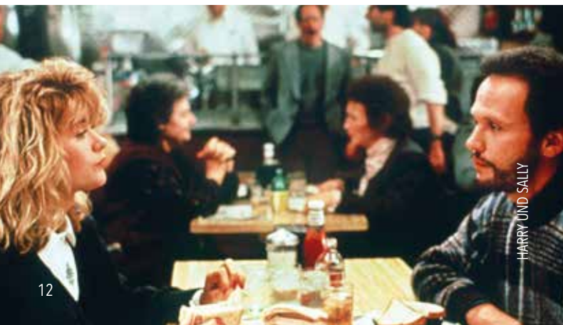
HARRY UND SALLY