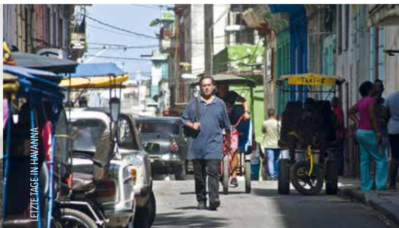
LETZTE TAGE IN HAVANNA