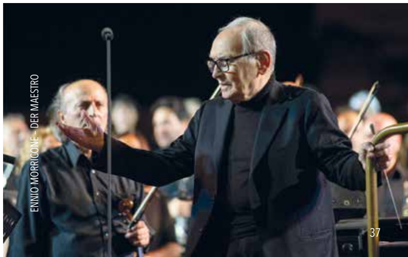
ENNIO MORRICONE – DER MAESTRO

BE 2021 | 156 Min | R: Giuseppe Tornatore Der große Filmkomponist Ennio Morricone bekommt kurz vor seinem Tod noch einmal die große Bühne. Chronik einer langen Karriere. Sa 13.8. 15:00 ABC