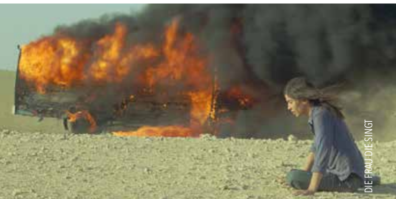
DIE FRAU DIE SINGT

Der Frankokanadier Denis Villeneuve ist einer der erfolgreichsten Filmemacher Nordamerikas. Mit DUNE hat er uns ein atemberaubendes Remake des sagenumwobenen Filmstoffs geschenkt.