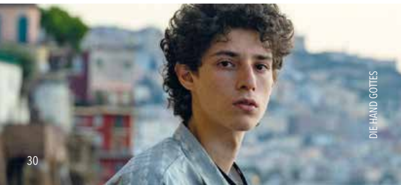
DIE HAND GOTTES