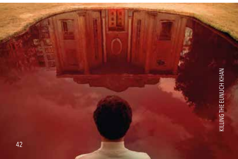
KILLING THE EUNUCH KHAN