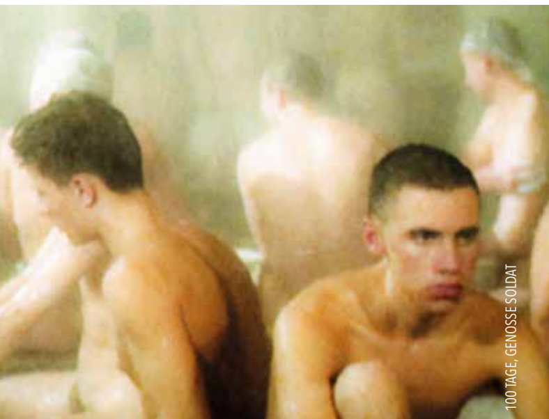
100 TAGE, GENOSSE SOLDAT

In Zukunft wird das Kino nach neuen Themen und Ausdrucksweisen suchen. Schon jetzt ist „Diversity“ das große Stichwort der Stunde. Wer weiß, vielleicht wird das Kinomachen in Zukunft wieder zu einem einträglichen Beruf. Und wichtig wird auf jeden Fall sein, das Kinderkino wieder stark zu machen. Der cinephile Blick schließlich feiert das Kino als Ort und als Medium.