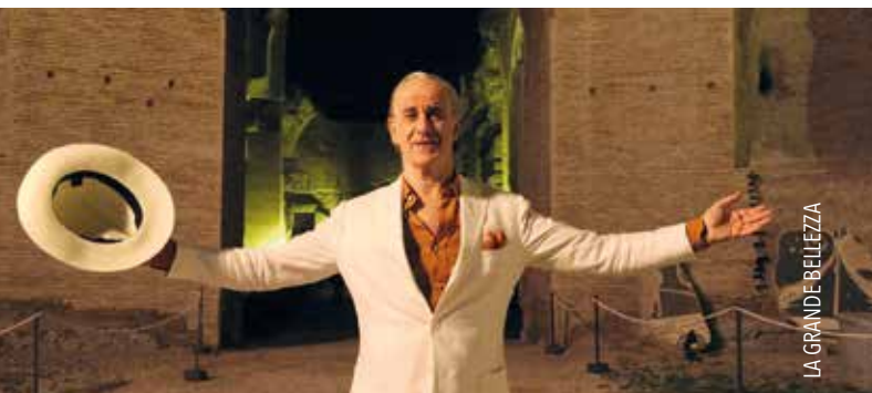
LA GRANDE BELLEZZA

Paolo Sorrentino ist Italiens opulentester Kommentator über den Zustand des Landes. Sein letzter Film über Diego Maradona, der eine Zeit lang in Neapel war, wurde auf Netflix versenkt. Das muss dringend korrigiert werden!