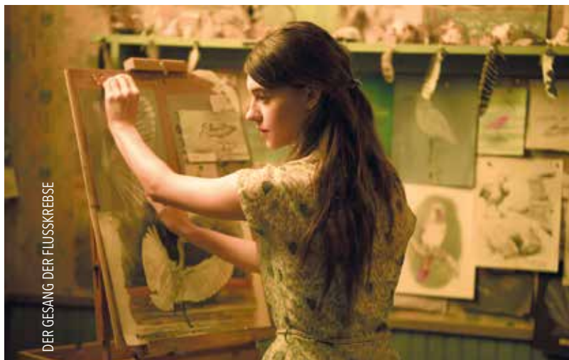
DER GESANG DER FLUSSKREBSE