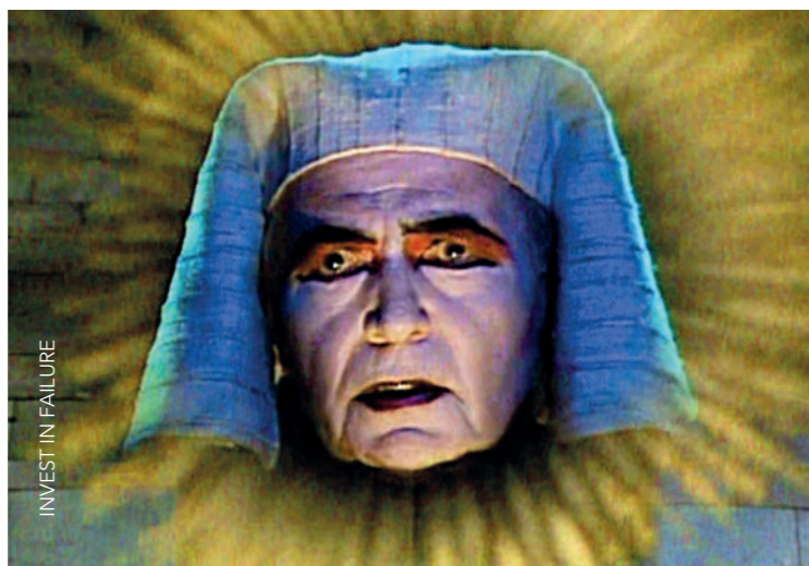
INVEST IN FAILURE