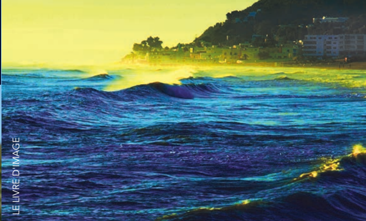
LE LIVRE D'IMAGE